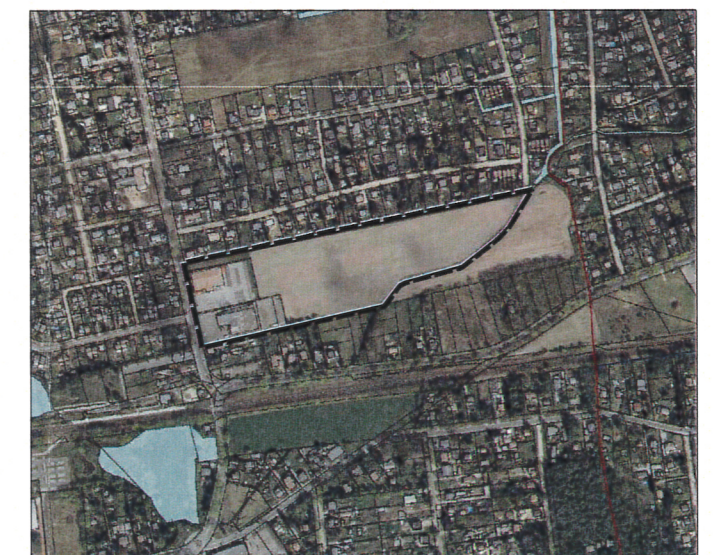
Übersichtsplan Lage des Änderungsbereichs, ohne Maßstab