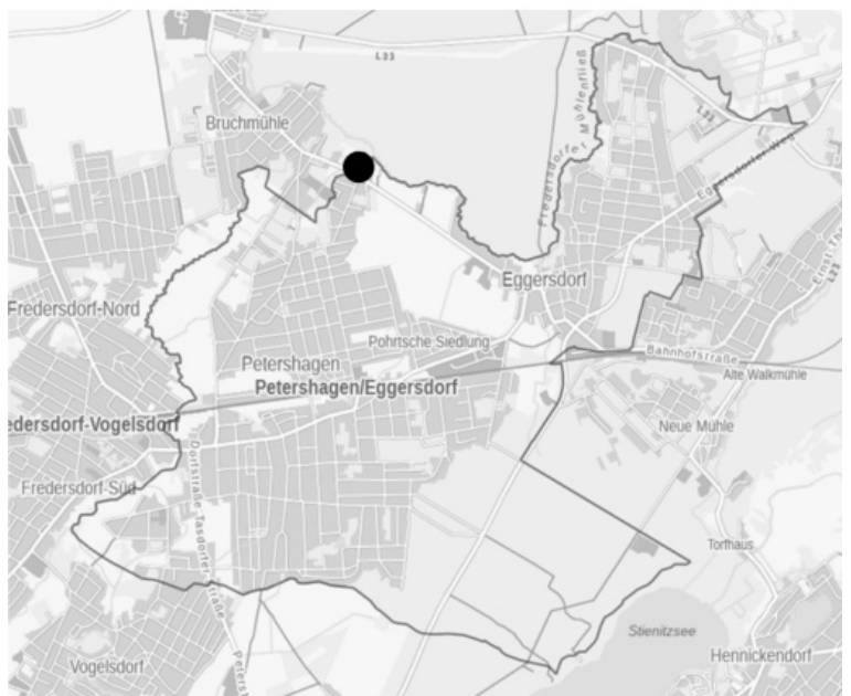
Abb.: Verortung Geltungsbereich im Gemeindegebiet