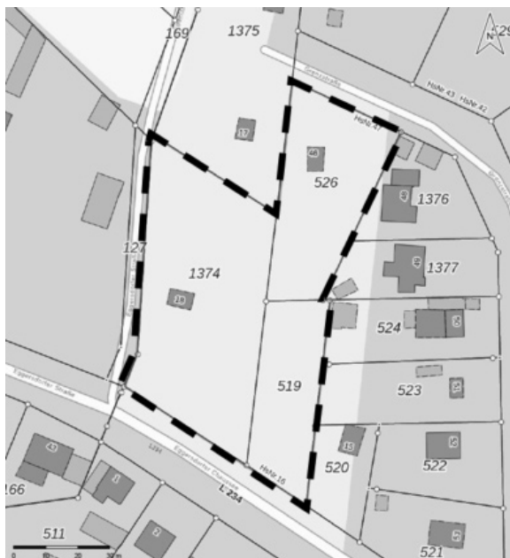
Abb.: Geltungsbereich des Bebauungsplans

Die Größe des Geltungsbereiches beträgt ca. 0,59 ha. Der Aufstellungsbeschluss wird hiermit gemäß § 2 Abs. 1 Satz 2 BauGB ortsüblich bekannt gemacht.