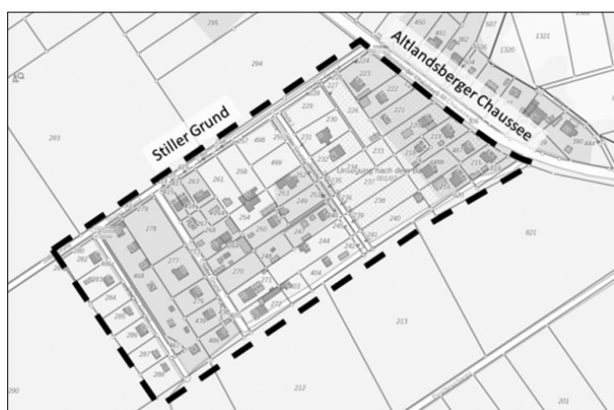
Geltungsbereich der 1. Änderung“

Der Bebauungsplan und seine Begründung werden auf Dauer im Fachbereich Bauen der Gemeindeverwaltung,