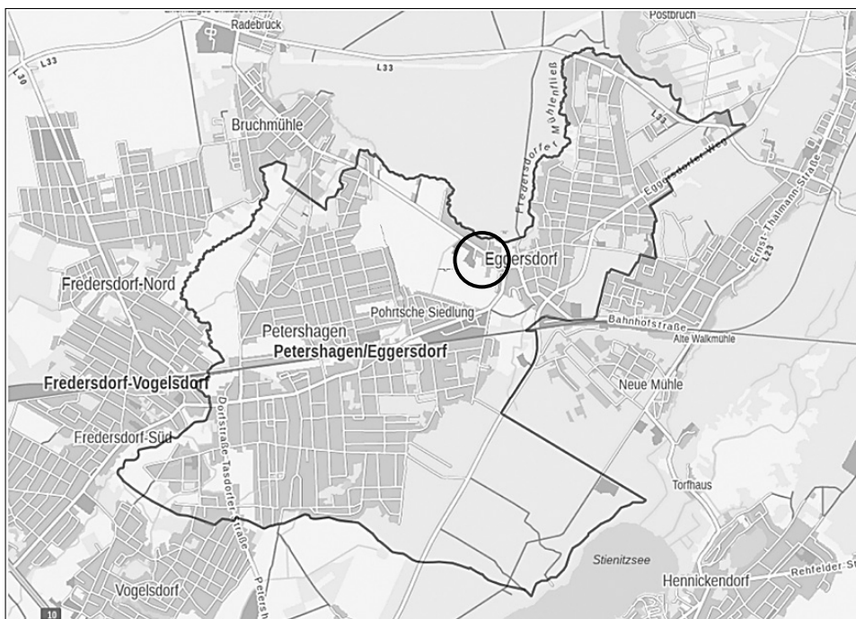
Lage im Gemeindegebiet