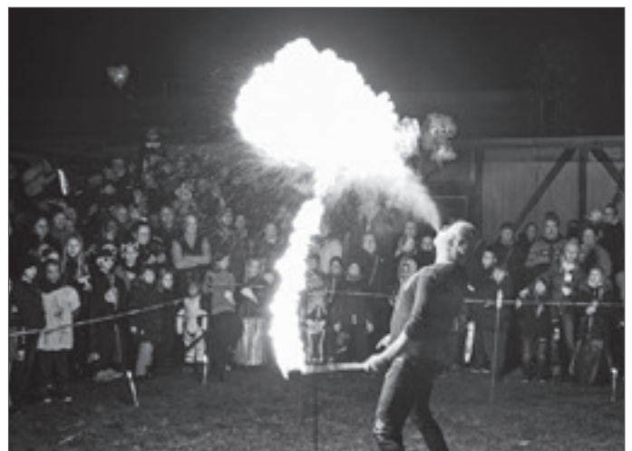
● Großer Andrang herrschte beim 5. Halloween-Spektakel mit Bauernvolk Eggersdorf und dem Eggersdorfer Carneval Club e.V. am 05. November Am Fuchsbau 5. Die Tanzsportler vom ECC zeigten auf der Bühne ihr Können. Ein Höhepunkt war ohne Frage auch wieder die Feuershow am Ende der Party.