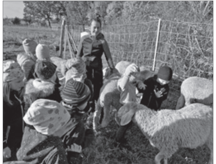
● Kinder der DRK-Kita „Pustebblume“ umringt von Schafen auf dem Gutshof der Berliner Stadtgüter.