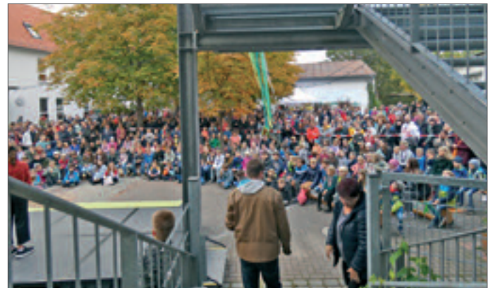
• Die Kochprofis vom Landgasthof zum Mühlenteich (1), vom Madels (2) und vom Gefleckten Schwein (3) haben die Gäste des Herbstfestes kulinarisch verwöhnt.