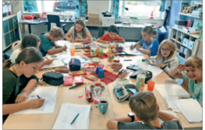
• Voll konzentriert: Kinder während der Schreibwerkstatt.