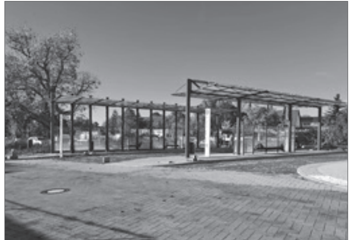
• Der Bahnhofsvorplatz im Ist-Zustand: Ende November soll er fertig sein.

Ombudspersonen übernehmen eine Mittlerrolle zwischen Einrichtungsleitung, Bewohnern und Öffentlichkeit. Bewerbungen bitte bis 02.12.2022 an post@petershagen-eggersdorf.de.