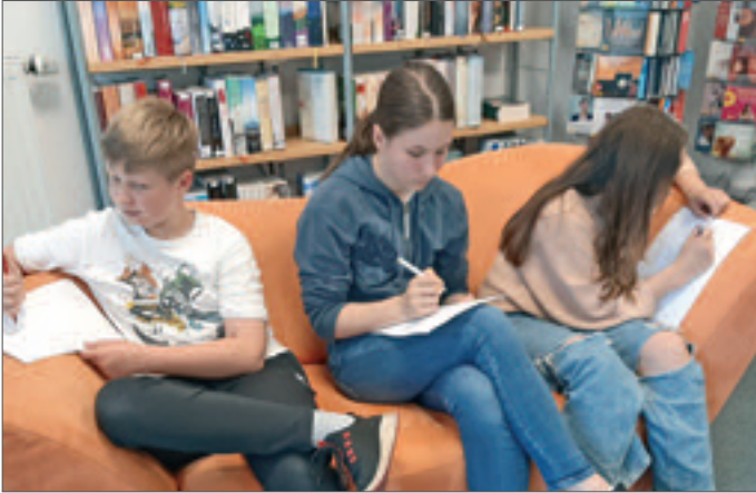
• Vertieft in die eigenen Texte...