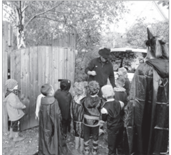
● Kinder der DRK-Kita beim Süßigkeitensammeln an den Gartentüren.