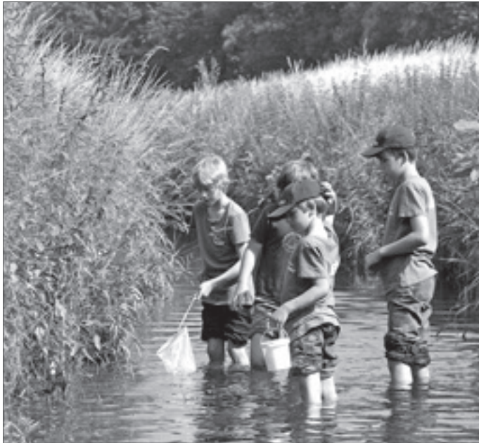
● Kleine Naturfreunde erforschen in einer NAJU-Gruppe ihre Umgebung.