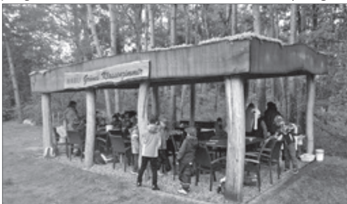
● Die Klasse 2a der Dorfbangergrundschule war zum Apfeltag beim NABU. Vereinsmitglieder haben gemeinsam mit den Kindern Äpfel geerntet und daraus Apfelmus gekocht. Dabei wurde natürlich auch das eine oder andere zum Thema "Äpfel" gelernt.

Der NABU Petershagen/Eggersdorf bietet ab Januar 2023 auch Kindern die Möglichkeit sich mit der Natur zu verbinden. In der neuen NAJU-Gruppe können Kinder im Grundschulalter immer am 1. Samstag im Monat von 10 Uhr bis 13 Uhr - passend zur Jahreszeit - Wiesen, Wälder und Bäche erkunden, Wildkräuter sammeln, Kanu fahren, oder einfach am Lagerfeuer zusammen Stockbrot genießen. Das gemeinsame Erleben in der Natur ohne Ablenkung, aber mit vielen kleinen Abenteuern soll im Vordergrund stehen. Zu wissen, Teil der Natur zu sein, ist das Eine. Dies aber intensiv zu spüren eine wertvolle Erfahrung, die wir gemeinsam machen wollen. Sicherlich werden wir oft am „Hauptsitz“, dem grünen Klassenzimmer, in der Friedhofstraße sein, aber je nach Thema auch an anderen Treffpunkten zusammen kommen. Wir möchten gerne mit den Kindern die Natur vor unserer Haustür erkunden – denn nur, was man kennt kann man schützen. Wer Lust hat mitzumachen, kann sich ab sofort unter kinder@nabu-petershagen-eggersdorf.de melden. NABU